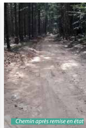
Chemin après remise en état

Par contre, le massif de la Sauvolle reste avec 2 chemins dégradés. L'entreprise concernée n'a pas donné suite à notre demande de remise en état malgré de multiples rappels de notre part. Il est à craindre que les frais de remise en état restent à notre charge !