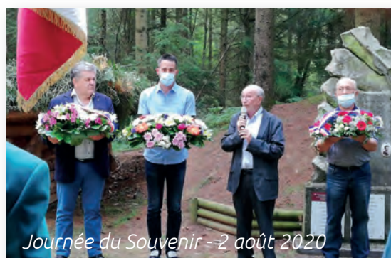
Journée du Souvenir - 2 août 2020