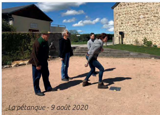
La pétanque - 9 août 2020

La marche des jonquilles a été prévue pour le samedi 20 mars 2021 : départ 14 h sur le parking à côté de la mairie. La tenue de cette marche vous sera confirmée.