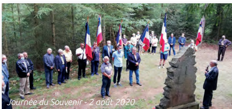
Journée du Souvenir - 2 août 2020